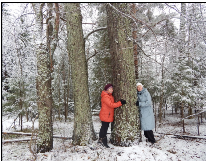
В священной роще « Губер вёсь»

Глазовский краеведческий клуб МУК «Глазовская районная ЦБС»