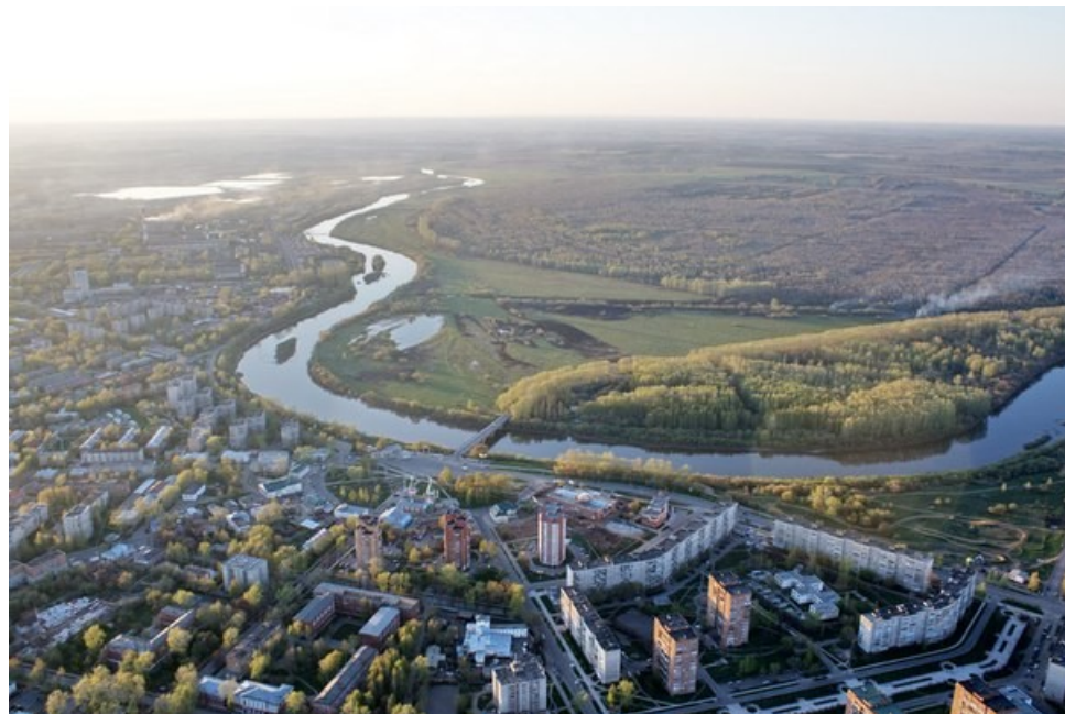
Бежит река Чепца, петляет (съемки с дельтаплана)