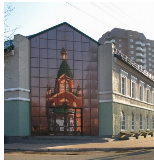
Храм Преображения Господня и его отражение на фасаде торгового центра «Вернисаж», чудесным образом увиденные и запечатленные фотохудожником