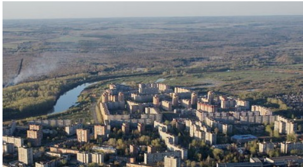
Современный вид Левобережья города Глазова с дельтаплана в 2012 году