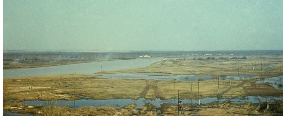
Левый берег реки Чепцы в паводок. На той стороне реки Хутор, на этом, левом берегу Лесозавод. Место это застроено и называется микрорайон Левобережье города Глазова. Снято с восьмого этажа дома 38, на улице Толстого, в мае 1975 года

Пейзажи, жизнь города Глазова и сельских поселений, интересные люди, встреченные на пути - все это можно увидеть на фотографиях Юрия Дерябина. Представленные работы - лишь небольшая часть того, что запечатлел фотограф.